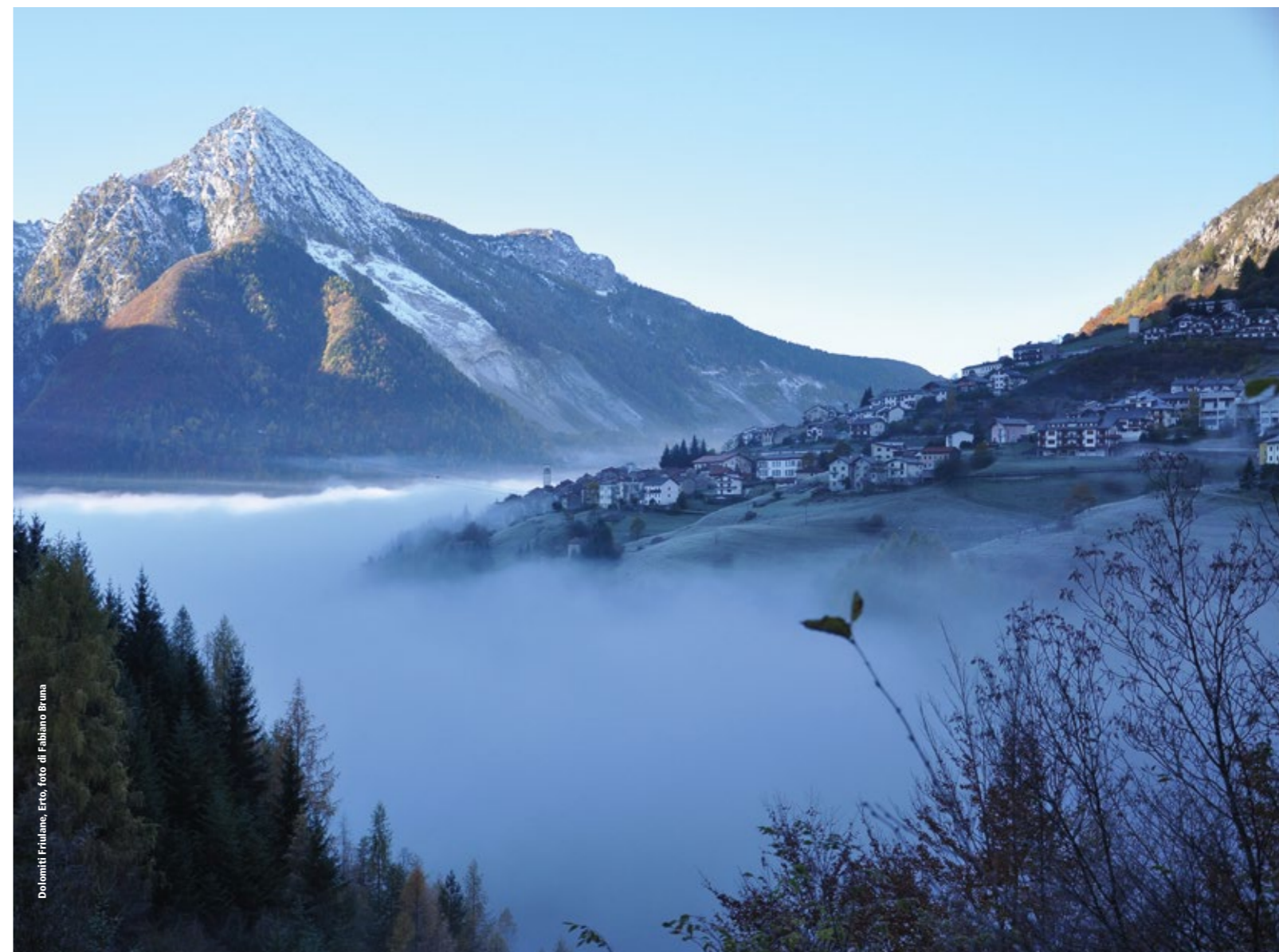
Dolomiti Friulane.

14/15/16 OTTOBRE 2021 - FORNI DI SOPRA, TOLMEZZO (UD)