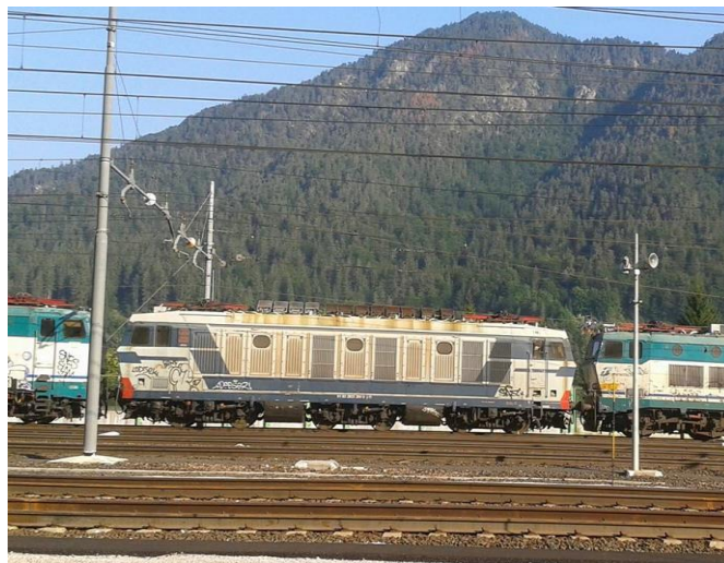
Foto del 22.07.2015 Stazione di Tarvisio Boscoverde

Tra le cause di ritardi lungo la linea 15 vi sono poi quelle legate alla manutenzione dei passaggi a livello : nonostante le rassicurazioni ricevute da RFI negli ultimi 6 mesi per ben 4 volte alcuni PL sono andati in tilt per il maltempo o per altri guasti tecnici.